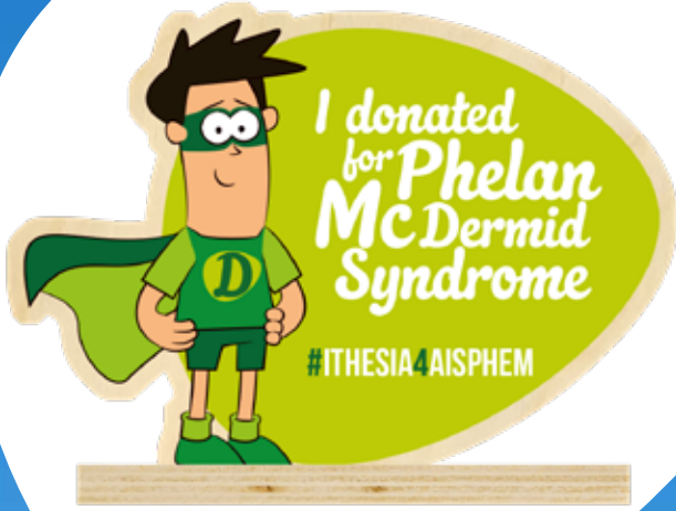
PREMIO IN LEGNO